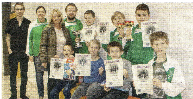
Viel Grund zur Freude hatte die Schülerligagruppe des Schachvereins Hörching mit ihren Trainern.