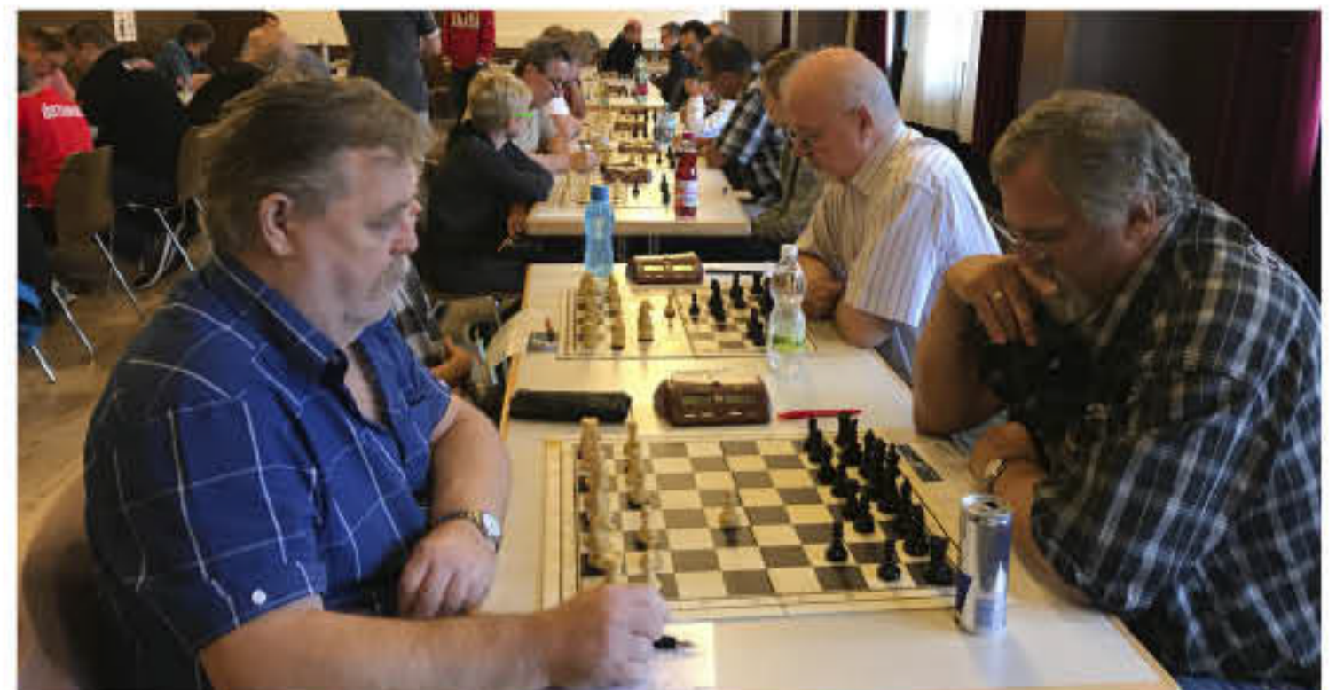
Spannende Duelle am Schachbrett gab es beim sechsten Sommerschluss-Schachopen.